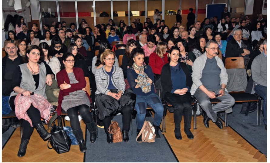
İlk gün düzenlenen açık kapı gününde Cemevi'ni ziyaret eden misafirlere kurum tanıtıldı.

B erlin Alevi Toplumu-Cemevi'nin düzenlediği 13. Alevi Kültür Haftası bir güzel konser ile sona erdi.