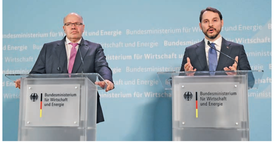
Enerji Bakanı Albayrak ve Alman mevkidaşı Peter Altmaier

Enerji Bakanı Berat Albayrak 4. "Uluslararası Enerji Dönüşüm Diyalogu" konferansına katılmak üzere Berlin'e geldi. Albayrak ziyaret çerçevesinde Federal Ekonomi ve Enerji Bakanı Peter Altmaier ile birlikte bir basın açıklaması yaptı.