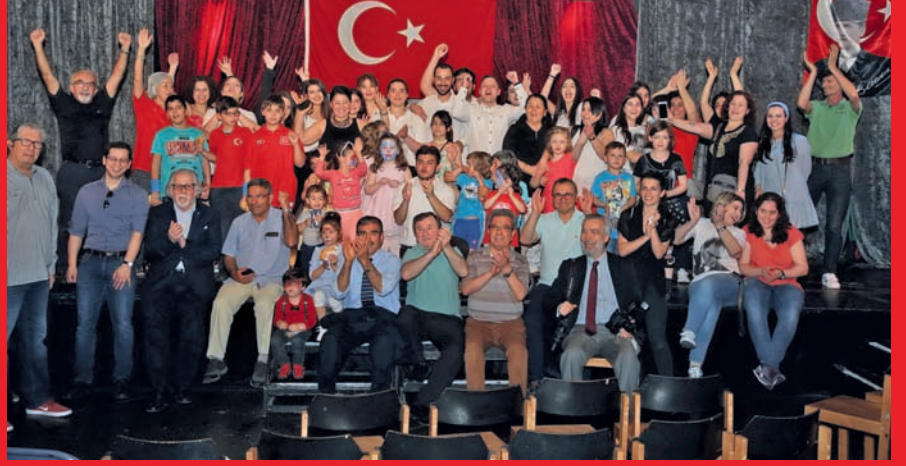
23 Nisan Ulusal Egemenlik ve Çocuk Bayramını, Tiyatrom'da kutladı.

Berlin-Brandenburg Atatürkçü Düşünce Derneği (ADD-Berlin) Türkiye Büyük Millet Meclisi'nin kuruluşunun 98. yıldönümü ve 23 Nisan Ulusal Egemenlik ve Çocuk Bayramını, Tiyatrom'da kutladı.