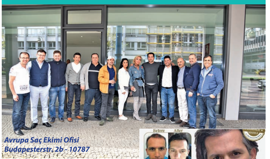
Avrupa Saç Ekimi Ofisi Budapesterstr. 2b - 10787

Berlin Ses Dergisi'ne saç ekimin anlatan Güçlü şunları söyledi: "Saç ekiminde hastanın önce baş bölgesinin fotoğrafı çekilir. Çünkü buna uygun olarak hastaya tedavi uygulanması gereklidir. Hiçbir doktor kendi zevki doğrultusunda işlem yapamaz.