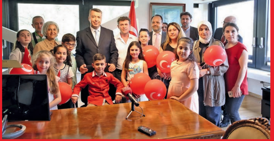
Berlin Başkonsolosu Mustafa Çelik, 23 öğrenciyi makamında kabul etti.

23 Nisan Ulusal Egemenlik ve Çocuk Bayramı Berlin Başkonsolosluğu'nda düzenlenen bir törenle kutlandı. Başkonsolos Mustafa Çelik sembolik olarak koltuğunu çocuklara devretti.