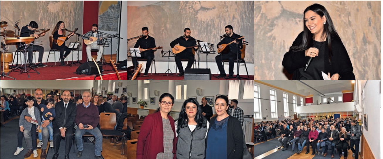
30 Mart - 1 Nisan 2018 tarihleri arasında düzenlenen kültür haftasında panel, açık kapı günü, saz dinletisi ve konserler düzenlendi.

Haber: Hüseyin İŞLEK