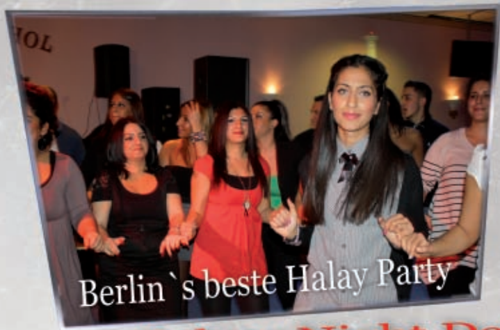
Berlin`s beste Halay Party